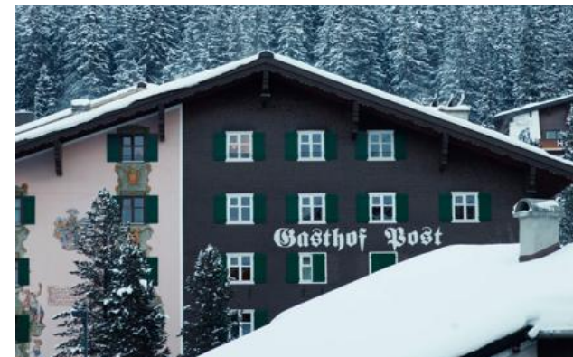
Membro Relais & Châteaux dal 1976 Dorf 11 6764, Lech am Arlberg (Vorarlberg)

Hotel e ristorante in montagna. Questo storico albergo, il Gasthof „Post“, è situato nel centro di Lech, una destinazione famosa in tutto il mondo per gli sport invernali. La lunga storia familiare dei luoghi, il suo fascino di casa di campagna, i pezzi d'antiquariato locale e un'amorevole attenzione ai dettagli creano un'atmosfera accogliente. Nei ristoranti pluripremiati per la bontà della loro cucina vi attendono dei piatti deliziosi. Il relax è completo alla Post Beauty & Spa, con la sua piscina panoramica spettacolare in mezzo alle montagne e delle suite per i trattamenti situate in una posizione straordinaria, nel cuore dello splendido giardino di Ebra.