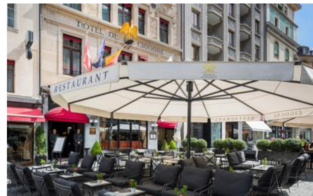
Membro Relais & Châteaux dal 1989 17, place Longemalle CH-1204, Genève

Hotel e ristorante in città. La scoperta delle bellezze ginevrine inizia con l'Hotel de la Cigogne, un'oasi di pace e tranquillità nel cuore della Ginevra animata e commerciale, a soli due passi dal centro storico, dal lago e dal quartiere culturale. Nella piazza Longemalle, la cicogna dorata che troneggia sulla porta dell'hotel annuncia un palazzo le cui camere, tutte diverse una dall'altra, sono state ripensate in un'ottica ringiovanita e dinamica. Per quanto riguarda la cucina, potete concedervi delle deliziose pause gastronomiche in questo scrigno dove le composizioni inedite si possono degustare anche sul terrazzo.